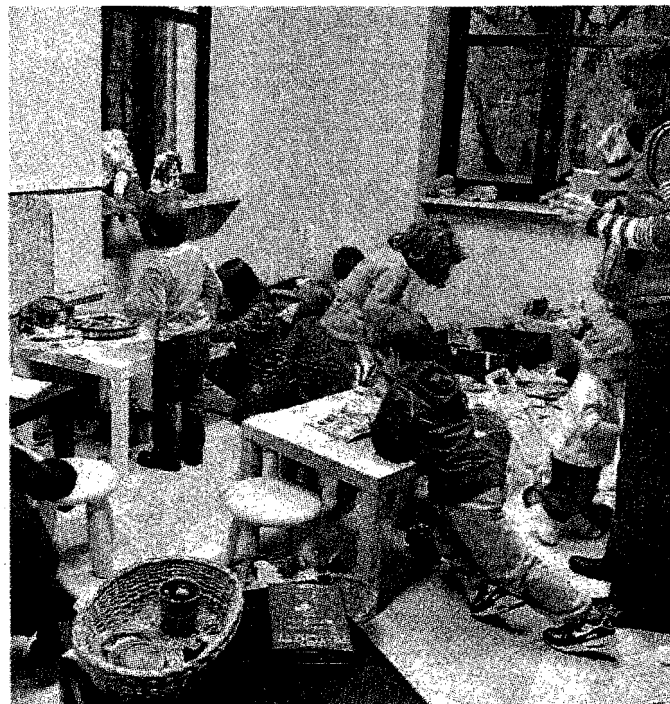
L'inaugurazione della ludoteca a Vanchiglia

decida di toglierci questi spazi che con fatica e tanta energia abbiamo allestito e ristrutturato». Qualcuno ha paventato un problema di sicurezza, perché i locali dell'Askatasuna non sarebbero certamente in regola per ospitare una ludoteca istituzionale. Ma secondo i genitori questo rischio non c'è, perché l'autorganizzazione delle famiglie comporta anche che ognuno "accudisca" i figli degli altri come se fossero i propri e che ci sia fiducia massima all'interno della comunità.